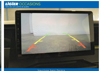
Vaucluse Sans Permis