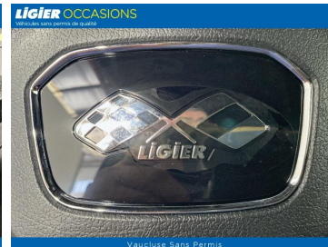
Vaucluse Sans Permis