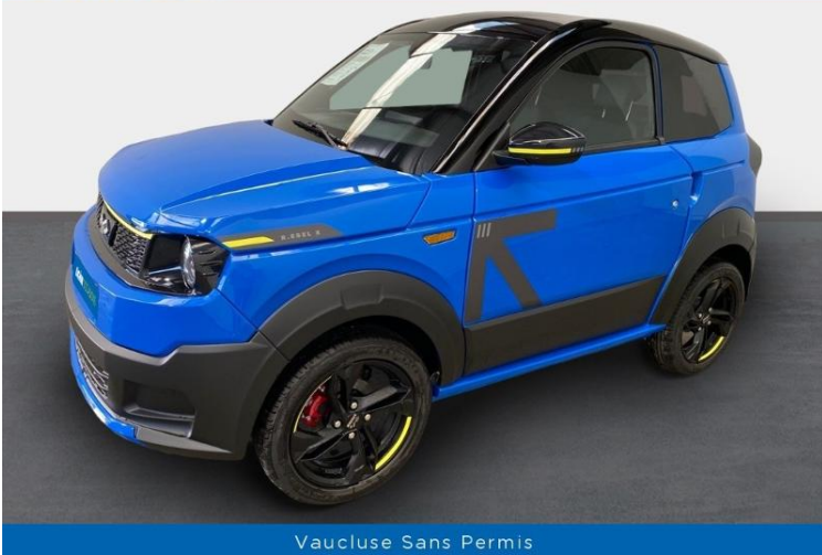
Vaucluse Sans Permis

LIGIER OCCASIONS Véhicules sans permis de qualité