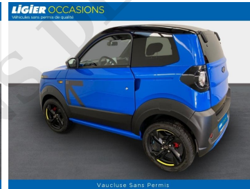
Vaucluse Sans Permis