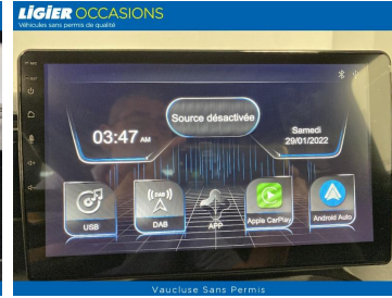
Vaucluse Sans Permis