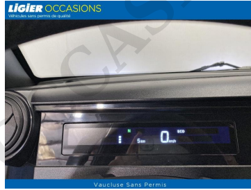
Vaucluse Sans Permis