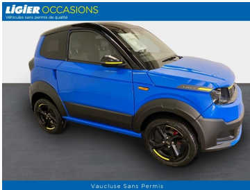
Vaucluse Sans Permis