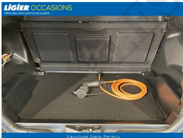
Vaucluse Sans Permis