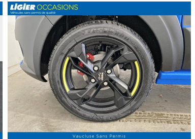
Vaucluse Sans Permis