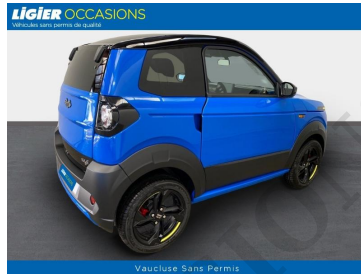
Vaucluse Sans Permis