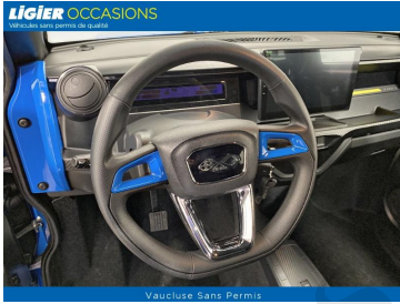
Vaucluse Sans Permis